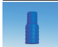
Entlüftungsstutzen / vent connection C1.0605.01