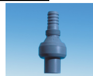
Rückschlagventil mit Entlüftung / non-return-valve with venting 3004.53.00