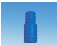
Entlüftungsstutzen / vent connection C1.0605.01