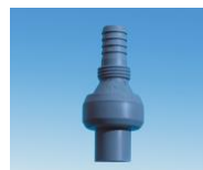
Rückschlagventil mit Entlüftung / non-return-valve with venting 3004.53.00