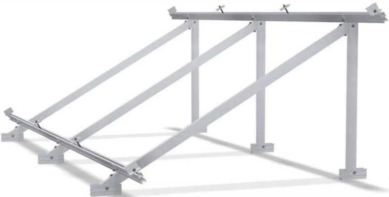
Perfiles completamente mecanizados, embalados y listos para su montaje.