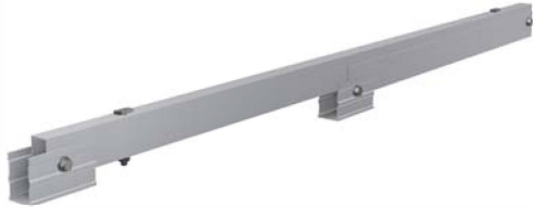
Triángulo plegado premontado