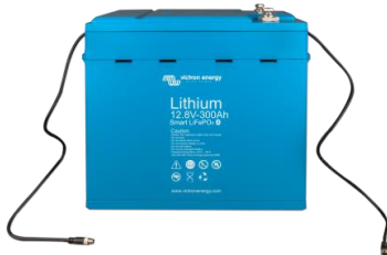
Batería LiFePO4 de 12,8V 300Ah

Las baterías de fosfato de hierro y litio (LiFePO4 o LFP), son las baterías tradicionales de Li-Ion más seguras. La tensión nominal de una celda de LFP es de 3,2V (plomo-ácido: 2V/celda). Una batería LFP de 12,8V, por lo tanto, consiste de 4 celdas conectadas en serie; y una batería de 25,6V consiste de 8 celdas conectadas en serie.