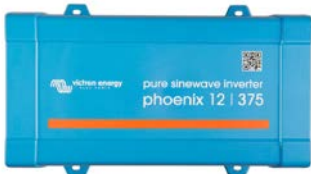
Phoenix 12/375 VE.Direct